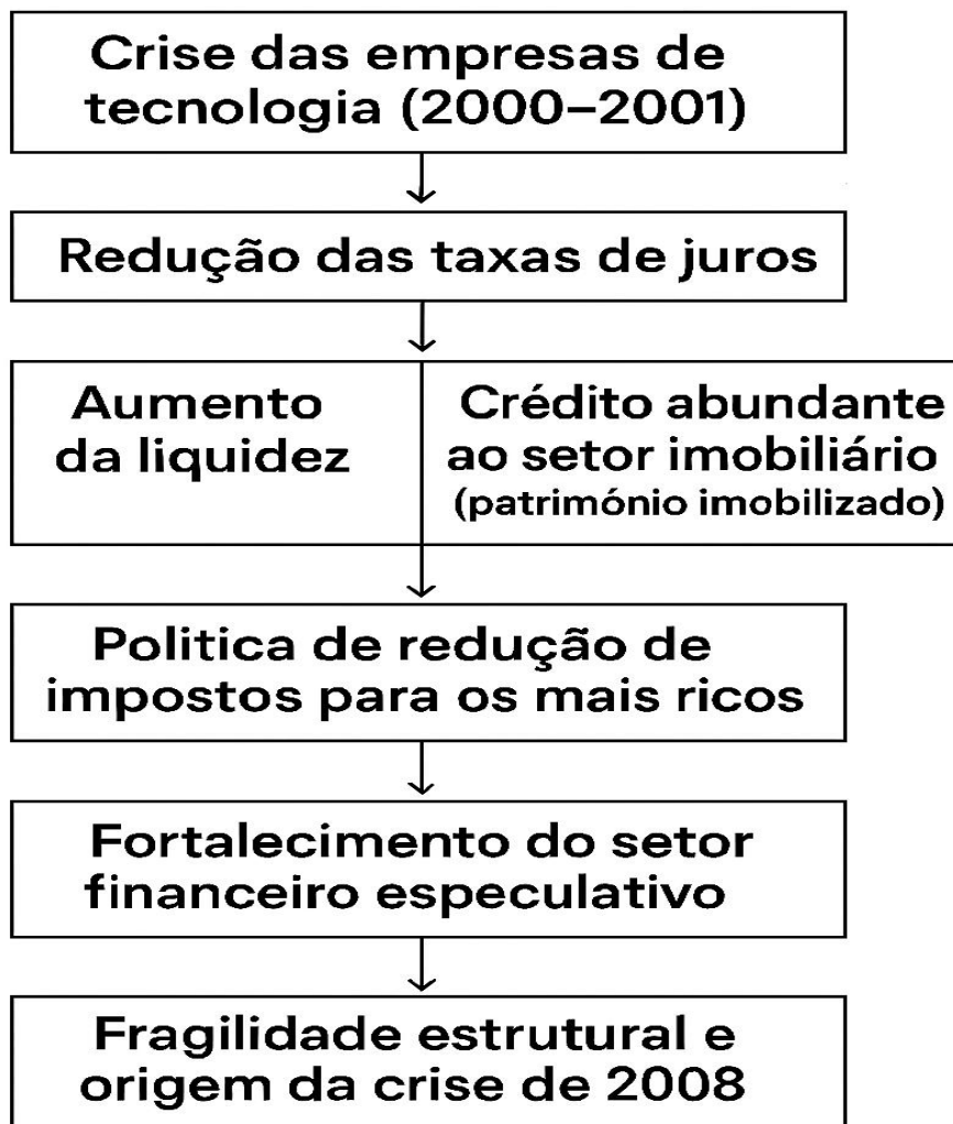
Figura 2- Sequência de eventos que originou a crise financeira de 2008 nos Estados Unidos 2 .