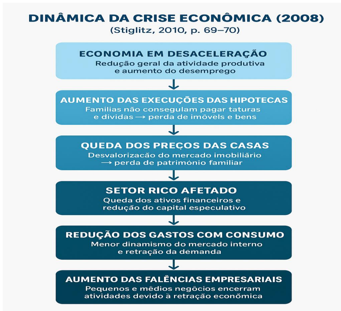
Figura 5-: Consequências da crise de 2008 a economia americana.