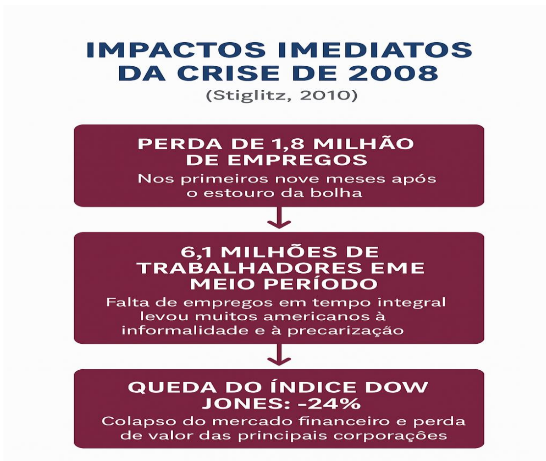
Figura 6- Impactos imediatos da crise de 2008.

No entanto, mesmo com todas essas evidências havia segundo o autor certa não aceitação por parte do governo Bush em relação a crise inclusive proferiam discursos otimistas de que a crise iria ser vencida naturalmente pelas forças do mercado.